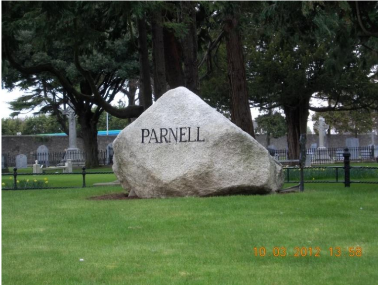
Parnell sírköve a Glasnevin temetőben, Dublin, saját fénykép

Charles Stewart Parnell halálhíreről Amerikában a The New York Times napilap tudósított. A „Devoy titkokat tár fel” című írásban beszámoltak a megemlékezésen mondott beszédéről. 26 Devoy akkor fedte fel a részleteit annak a titkos találkozásnak, amelyet Charles Parnell, Michael Davitt (1846-1906) és Devoy tartottak több mint tíz évvel korábban. Elmondta, hogy betartotta ígéretét, miszerint senkinek nem szól ezen tárgyalásokról, de Parnell halálával már nem köti az ígéret. A közönség hitetlenül hallgatta a beszámolót. 1879 májusában, Dublinban, a három résztvevő több ízben találkozott a Morrison’s Hotelben, ahol Írország jövőjéről értekeztek. A tárgyalás eredménye a New Departure (Új útvonal) elnevezésű egyezmény lett, amely merőben új irányzatot mutatott az ír politikában. Míg korábban a békés, politikai, alkotmányos megközelítés szigorúan elhatárolta magát a lázadó, erőszakos, forradalmi megmozdulásoktól, addig ezeken a találkozókon a két politikus és a forradalmár közös nevezőre jutott. Parnell vállalta, hogy minden erejével a Home Rule, azaz az önrendelkezési jogot követelő mozgalmat fogja támogatni. Ezzel Írországnak megadta az a jog, hogy a sziget területén