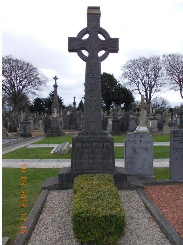
John Devoy sírja a Glasnevin temetőben, Dublinban

tartják számon, addig John Devoy személye sokkal inkább háttérbe szorult.