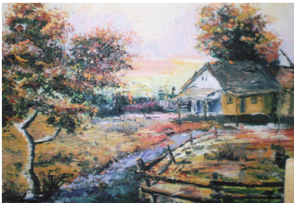
2. és 3. kép Tipikus orompart túli tanyák