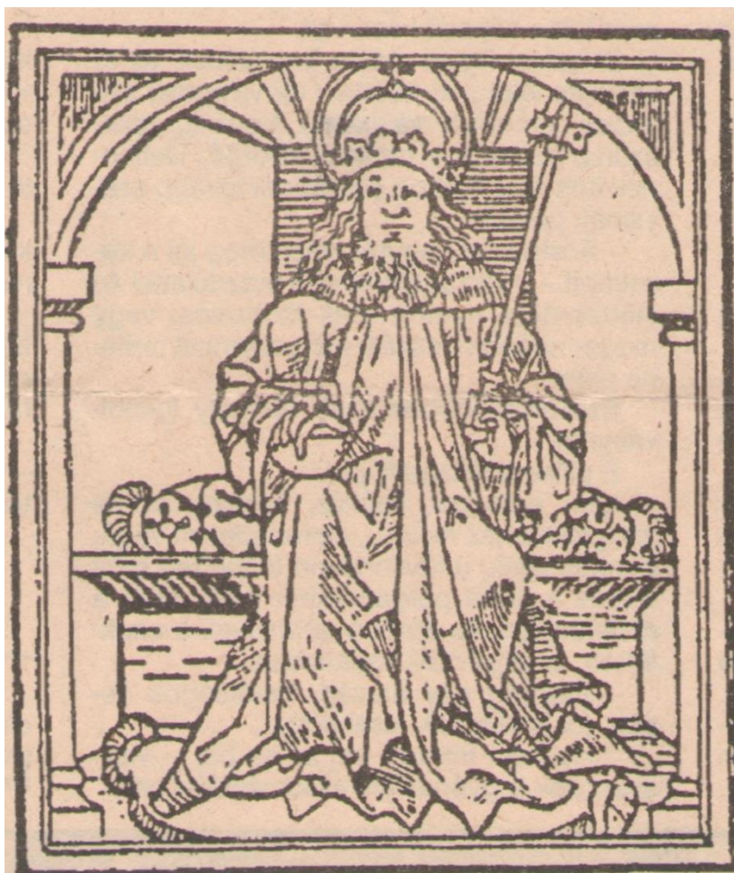
1. kép: Szent István Király (a Thúróczy – Krónikából)

Megalakította országszerte az első királyi megyéket, azaz vármegyéket, mint Bács, Bodrog, Szerém vagy Valkó, a Dunától délre. Ugyanakkor egyházi központok is alakultak Dél-Bácskában. Az egykori okiratokból tudjuk, hogy Bácsban püspökség alakult, Titelen prépostság, míg plébániák alakultak Péterváradon (Vásárosváradon), Aranylábú Bácsón, Temerinben és más helységekben. Bélakúton apátság létezett.