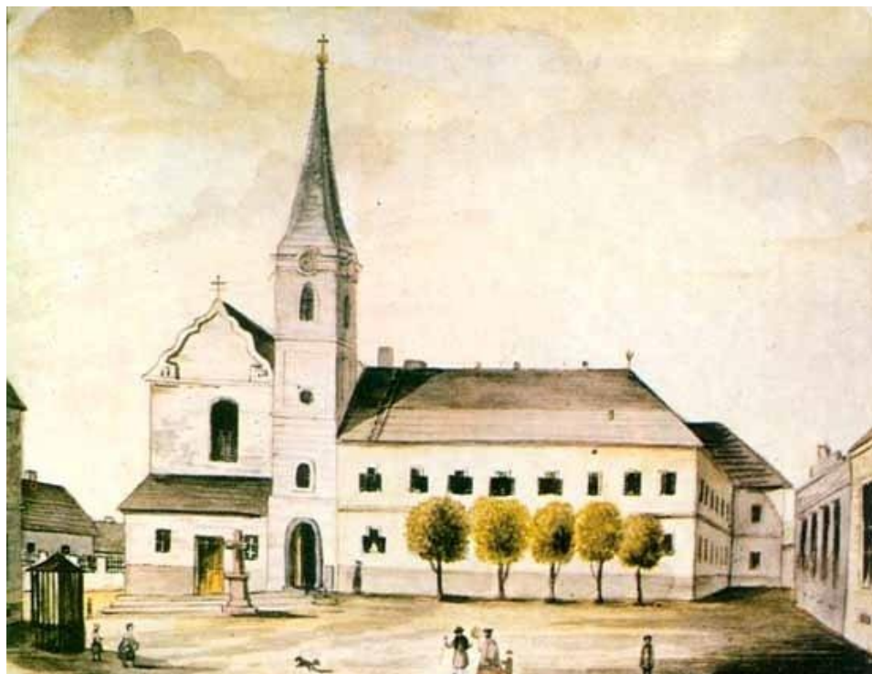
A mai szabadkai ferences templom, ahol egykor török-kori vár állt