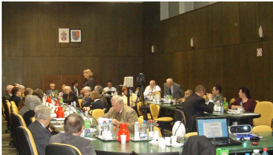
A tanácskozás résztvevői