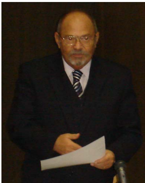
Nagy Ferenc főkonzul, a Magyar Köztársaság szabadkai Főkonzulátusa nevében üdvözi a tanácskozás résztvevőit