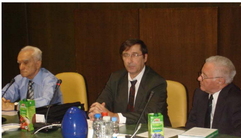
A tanácskozás elnöksége: